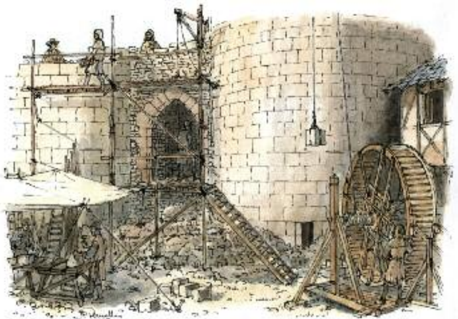
Un atelier de tailleur de pierre, une grue médiévale prendront place sur le chantier. Dessin JP Deruelles

L'autre point fort sera le lancement d'un grand chantier de restauration des remparts de la Porte des Ormeaux qui sera lié à la mise en place d'une école de formation aux techniques médiévales du bâtiment, antenne de campus de formation compagnonnique . Cette activité est prévue sur plusieurs années. Plus de 10 ans de chantier sur un magnifique Monument Historique, un chantier qui formera les artisans de demain. Parmi les premières formations retenues par le Centre de Formation Professionnelle de Construction on peut citer : “Maçon du bâti ancien” , Charpente équarrissage intégrant le ceinturage et la coupe de bois de pays, le piquage sur bois travaillés à la main et une initiation Ergolevage.